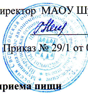
График приема пищи